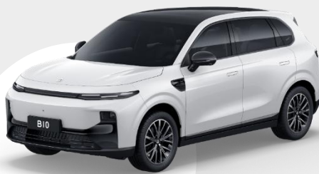
BIELA LIGHT € 750