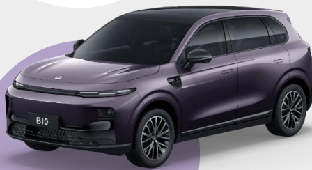
FIALOVÁ DAWN € 750