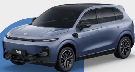
MODRÁ STARRY NIGHT € 0