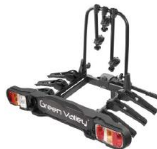
Nosič bicyklov na ťažné zariadenie Discovery-3 Pre 3 bicykle / 2 elektrobicykle. Vyrobený z hliníka a vysokopevnostnej ocele. Skladací, uzamykateľný, sklopný. Číslo dielu: 160 514-3 Cenníková cena: 370 €