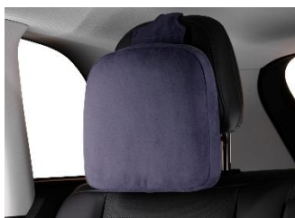
Komfortná opierka hlavy Šedá (600 268 78 73) Fialová (600 268 78 74) Cenníková cena: 55,39 €