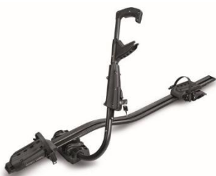
Strešný nosič na bicykel FAST BIKE Montáž na obe strany strechy, na priečniky bez použitia náradia. Dvojitý systém uzamykania. Číslo dielu: 160 661 Cenníková cena: 112 € Pre uchytenie do nosiča bez drážky je potrebná montážna sada (číslo dielu: 160 850, cena: 8,15 €)