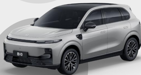
ŠEDÁ TUNDRA € 750