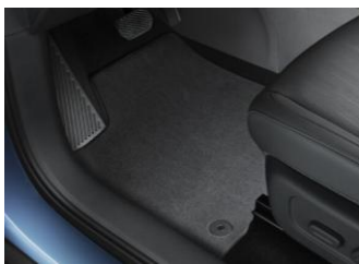
Súprava tvarovaných kobercov Velúr, vpredu&vzadu (3ks) Číslo dielu: 600 268 71 98 Cenníková cena: 81,91 €