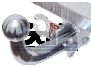
Ťažné zariadenie Skrutkové prevedenie A Číslo dielu: L0335I Cenníková cena: 188,19 €