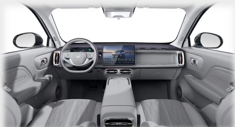
Design - Svetlošedá