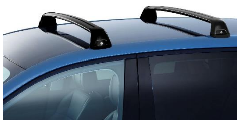
Súprava 2 priečných strešných nosičov Umožňuje inštaláciu strešných boxov, nosičov bicyklov a podobného príslušenstva. Číslo dielu: 600 268 71 97 Cenníková cena: 672,21 €