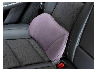
Komfortný vankúš Šedý (600 268 78 75) Fialový (600 268 78 76) Cenníková cena: 29,06 €