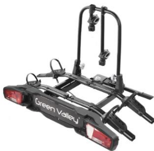
Nosič bicyklov na ťažné zariadenie E-explorer Pre 2 elektrobicykle. Vyrobený z hliníka a vysokopevnostnej ocele. Uzamykateľný a sklopný. Číslo dielu: 160 674 Cenníková cena: 394,56 €