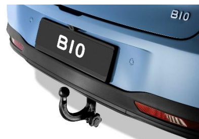
Ťažné zariadenie Originál Leapmotor Číslo dielu: 600 268 71 94 Cenníková cena: 1.118,73 €