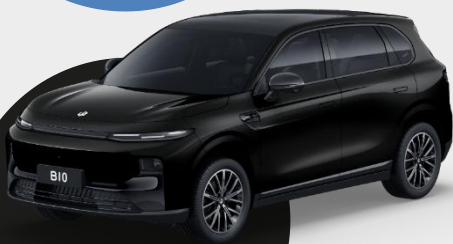
ČIERNÁ METALLIC € 750