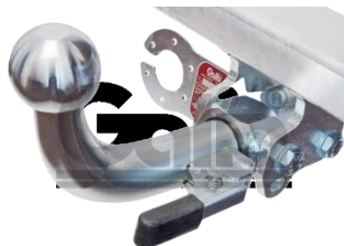
Ťažné zariadenie Bajonetové prevedenie C Číslo dielu: L0335C Cenníková cena: 268,14 €