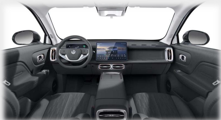
Design - Tmavá