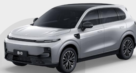
STRIEBORNÁ GALAXY € 750