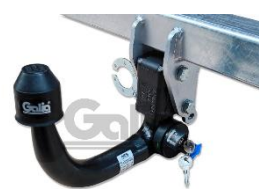
Ťažné zariadenie Prevedenie Vertikál V Číslo dielu: L0335V Cenníková cena: 436,65 €

K ťažnému zariadeniu Galia je potrebné objednať aj káblový zväzok. Ten zohľadňuje špecifiká vozidla, zaručuje spoľahlivosť, jednoduchú montáž a zablokovanie parkovacích senzorov pri zapojení zásuvky prívesu TOW BAR - CONTROLLER, Číslo dielu: 600 268 71 95, Cenníková cena: 179,68 € TOW BAR - WIRING HARNESS, Číslo dielu: 600 268 71 96, Cenníková cena: 172,34 €