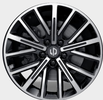
18" DISKY Z LAHKEJ ZLIATINY